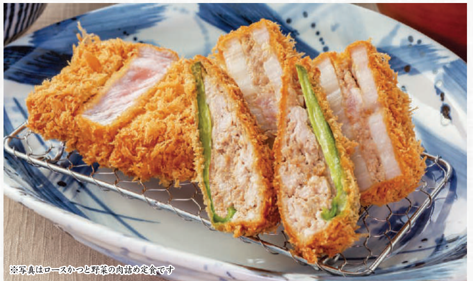
※写真はロースかつと野菜の肉詰め定食です